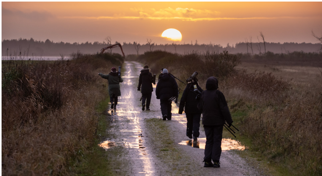
Filsö. Äntligen fick vi in sångsvan.

Nu börjar tiden med dagsljus bli knapp, vi åker mot Filsö. Framme går vi på en väg med en vacker solnedgång framför oss, en hel del gäss och så äntligen fick vi kryssa en sångsvan. Nu börjar det skymma på riktigt, här finns ett fågeltorn ut mot en sjö som är Danmarks största återskapade ö. Här har man i maj 2019 registrerat 252 fågelarter, nytillkomna häckande arter är bl.a havsörn, hornuggla, rördrom och trana. Vi såg trots skymningen svanar och smådopping. Samlade ihop 60 arter idag.