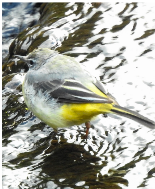
Även forsärlan gillar Vramsån

Kan konstatera att dagens runda inte blev någon ekorunda men det går att ta bussen till Gärds Köpinge och Tollarp för den som vill bekanta sig närmare med detta