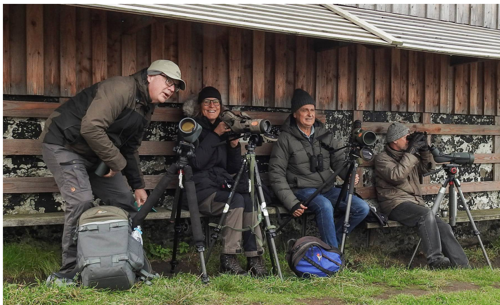
Att sträckskåda sittandes i lä under tak är en lyx som vi inte alltid är vana vid.

ca 400 sulor inne i Skälderviken som snurrade runt. Och nog fanns det sulor alltid! Flera tiotals sulor passerade oss på sin väg västerut, ut ur Skälderviken. En storlabb gjorde tvärtemot och drog österut in i viken. Alkor svishade förbi och några tumlare visade sina ryggar. En pilgrimsfalk for snabbt förbi och flera stenfalkar hade bråttom iväg, såsom de alltid tycks ha. Senare under dagen fick vi reda på att precis när vi lämnat Kullaberg hade en tonfisk gjort luftsprång utanför klipporna. Attans att vi missade den!