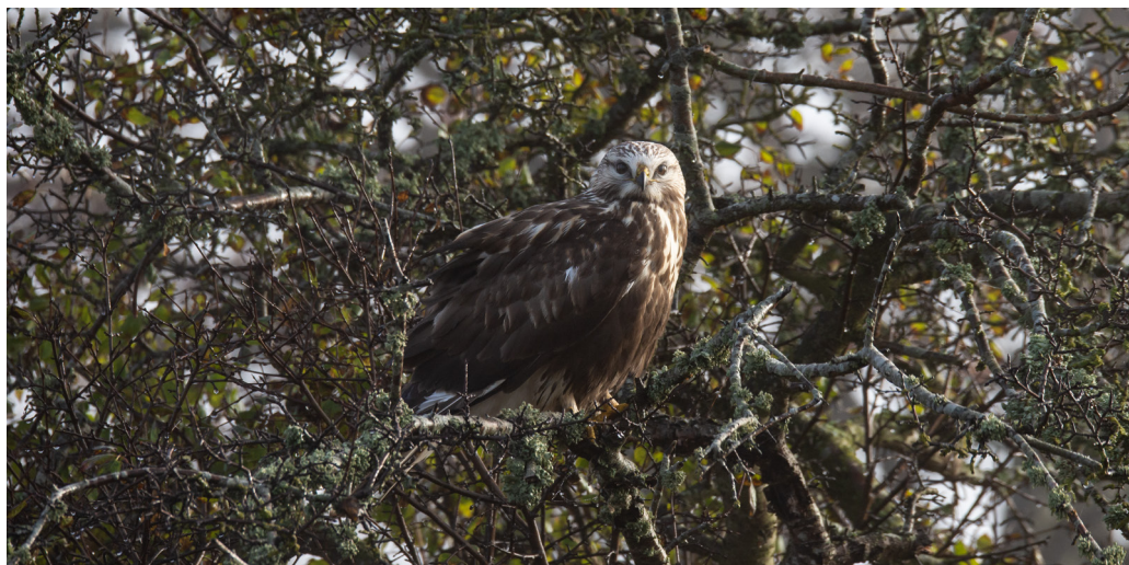
Fjällvråk