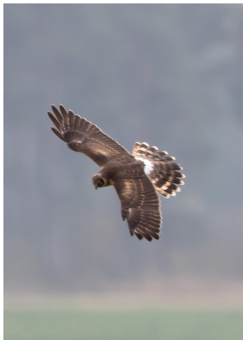
Stäpphök i Håstad

är synnerligen ovanligt att tallbitar når ner till våra trakter, och det krävs en rejäl invasion för att öka chansen att få se dem. Precis det hände i höst. Plötsligt kom larm om 100-tals på väg söderut i Mellansverige, och några dagar senare hade vi dem här. Framför allt den flock som uppehöll sig öster om Fjälkinge backe på Lilles backe under några dagar, gav besökare