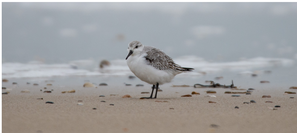
Sandlöpare